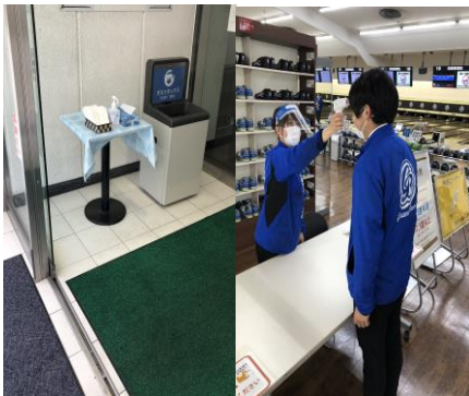
入口で検温・消毒とマスク着用をお願い

●ボウリング場の新型コロナ感染防止対策一例(8月現在の様子。状況により随時変更していきます。)