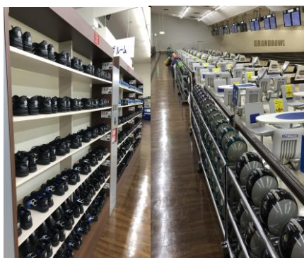
シューズ・ボールなどは全て消毒済み