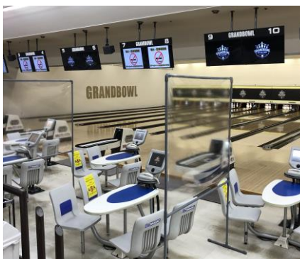
各レーン毎に感染防止シールドを配備