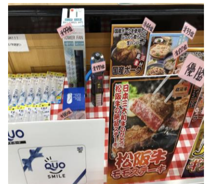
景品のご用意や配送も可能

●新狭山グランドボウル 団体予約料金表(2020年4月1日～) ※税込 ※詳細は別紙「団体予約案内」参照