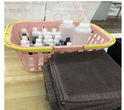
新しい消毒液とボールタオルを配布